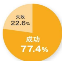
消火器を使用した初期消火の成功率

初期消火で消火器を使用した場合、75%以上が成功しています。万が一火が出てしまった場合、消火器を使用した初期消火は大変有効です。