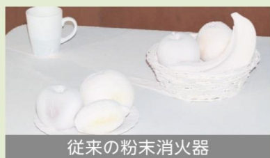
従来の粉末消火器